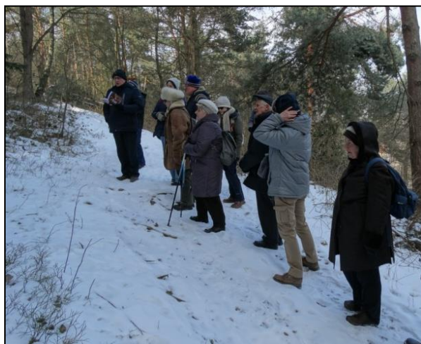
Droga Krzyżowa w roku ubiegłym