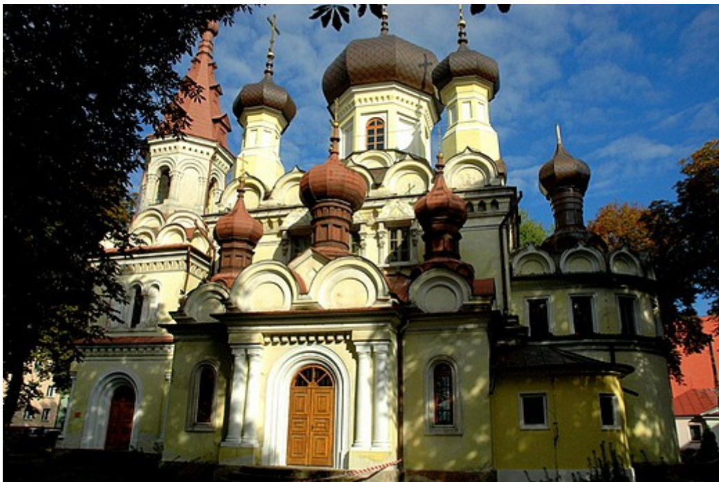
Cerkiew prawosławna pw. Zaśnięcia Najświętszej Marii Panny w Hrubieszowie