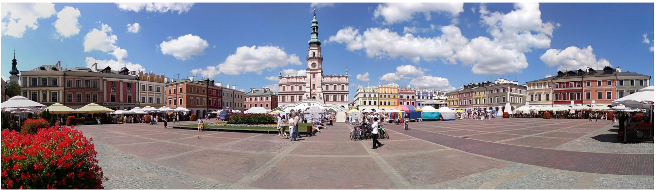
Rynek Wielki w Zamościu