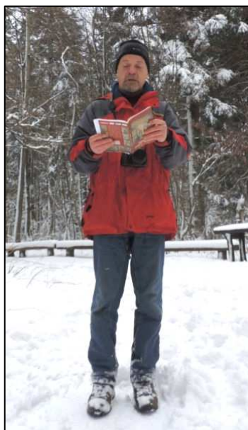
autor - R.Kulak

Co roku spotykamy się przy kapliczce św. Mikołaja w Łysogórach. Spotykamy się na rajdzie, który za patrona ma św. Mikołaja. Ta tradycja rozpoczęła się ufundowaniem przez uczestników kursu na przewodników świętokrzyskich w Bielinach figury Świętego (autorem rzeźby jest p. Jarosław Winiarski z Bielin), którą obecnie możemy podziwiać w kapliczce oraz inauguracją Odznaki Turystycznej „Szlakami Św. Mikołaja”. I jak co roku pragnę słów kilka powiedzieć o Naszym Patronie. Skupię się tym razem nie na biografii świętego – zainteresowanych odsyłam do naszej strony internetowej www.pttkkielce.pl do zakładki odznaki, gdzie możemy te informacje prze-