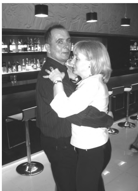
Fot. A. Hendler