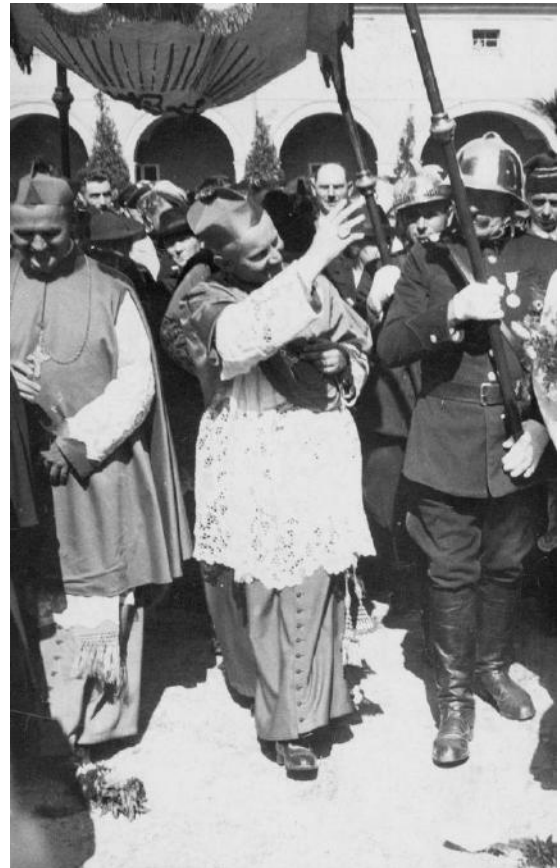
Biskup Czesław Kaczmarek w czasie ingresu do katedry kieleckiej 4 września 1938 r.

Wystawa czynna od 11 listopada 2008 do 31 marca 2009 r.