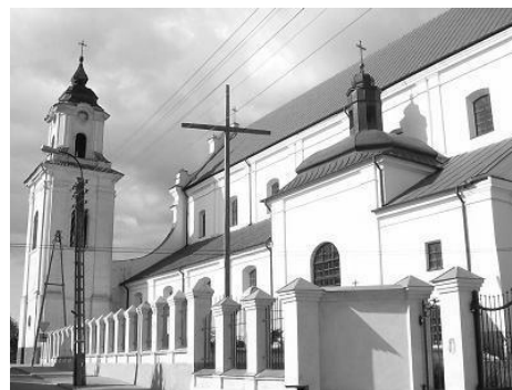
Zespół klasztorny franciszkanów

w Drohiczynie. W cerkwi prawosławnej p.w. św. Mikołaja odbywało się już nabożeństwo w języku starocerkiewno-słowiańskim. Około południa wyruszyła procesja z barwnymi chorągwiami. Szła stromą drogą do brzegu Bugu, który był skuty lodem. W pobliżu brzegu, wbity w lód, tkwił drewniany, prawosławny krzyż. Przed nim stał krzyż wycięty z lodu, a obok niego dwa ścięte świerki. W przeręblu, wyciętym w lodzie na kształt krzyża, kapłan dokonał aktu poświęcenia wody zanurzając w niej krzyż, to znów kropiąc wodą święconą. Następnie wierni wypuścili gołębie, a na zakończenie nabrali z przerębla wody do naczyń. Po zakończeniu ceremonii poświęcenia wody, procesja wróciła do cerkwi. Tam ksiądz proboszcz wygłosił homilię po polsku, a na zakończenie dał wiernym do pocałowania krzyż.